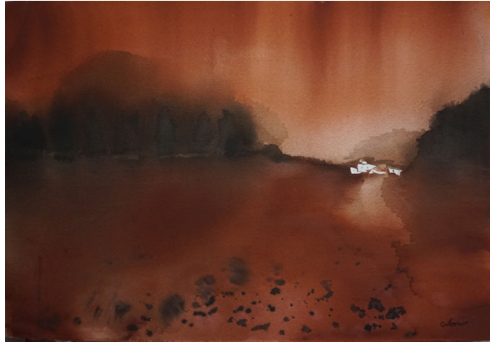
Leonor Ramírez Serrano “SILENCIO” 35 x 50 cm.

Viento rojo en los sauces. En un cielo cobrizo estertores antiguos. ¿Quién manda estas señales? ¿Qué anuncian esta tarde? Un temblor se refugia en mi corazón y oye. ¿Qué? ¿Qué dice el Silencio? Es apenas un eco. Todo se haya velado tras un muro de niebla y es como si quien hablara fuera un mudo reflejo: La luz en la neblina.