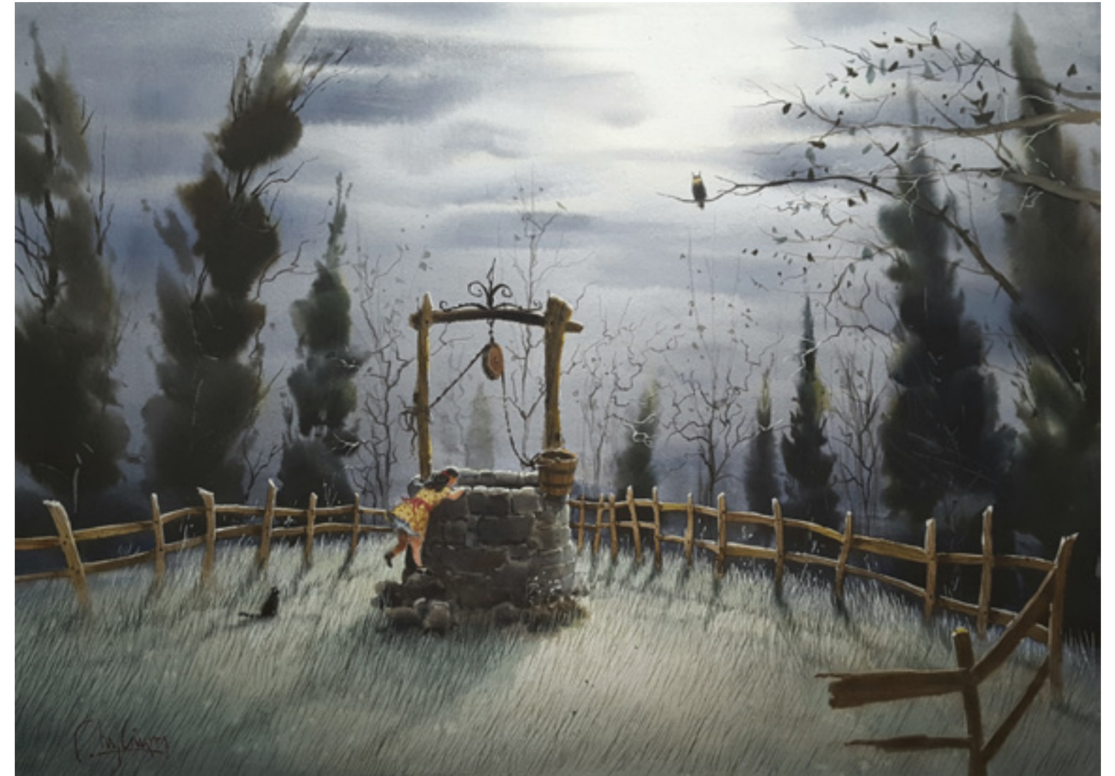
Miguel Linares Ríos “CURIOSIDAD NOCTURNA” 35 x 50 cm.

Sentadita en el brocal del pozo estaba la niña buscando que su morriña pudiera echar a volar más allá del barandal. Y mirando en el bruñido espejo del agua el nido en que la luna lucía se asomó por si se oía de ese rostro algún sonido. Por más que escuchó, callado se encontraba aquel bajío y era tal el poderío del silencio que era el amo de aquel recinto encantado. Levantando sus enaguas quiso tocar en la fragua del espejito del fondo y en un bocado redondo se la tragarón las aguas.