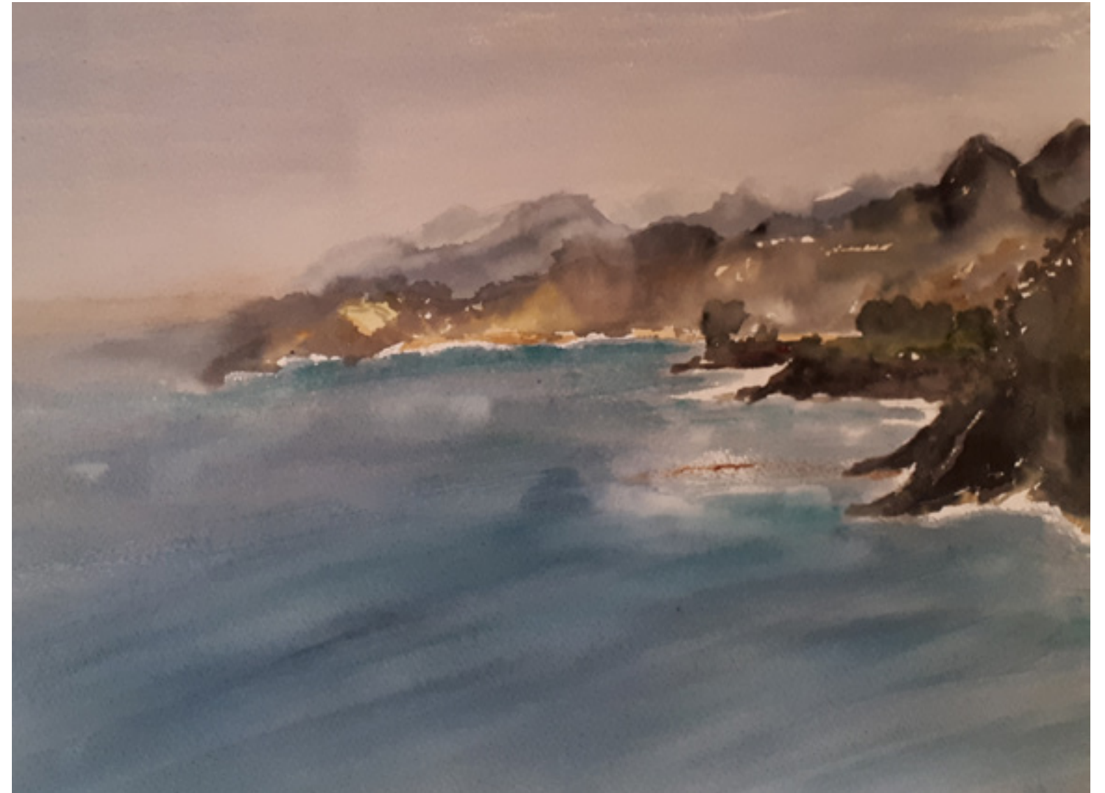
Marisol Pérez Cabrera “AGUA” 30 x 50 cm.

Ese beso de musgo que acaricia en secreto entre el roquedo... Ese rumor de olas con dulzura hialina en el arroyo... Ese temblor de espuma que un soplo levanta entre vilanos... Y ser ritmo en el ritmo y ser ola en las olas