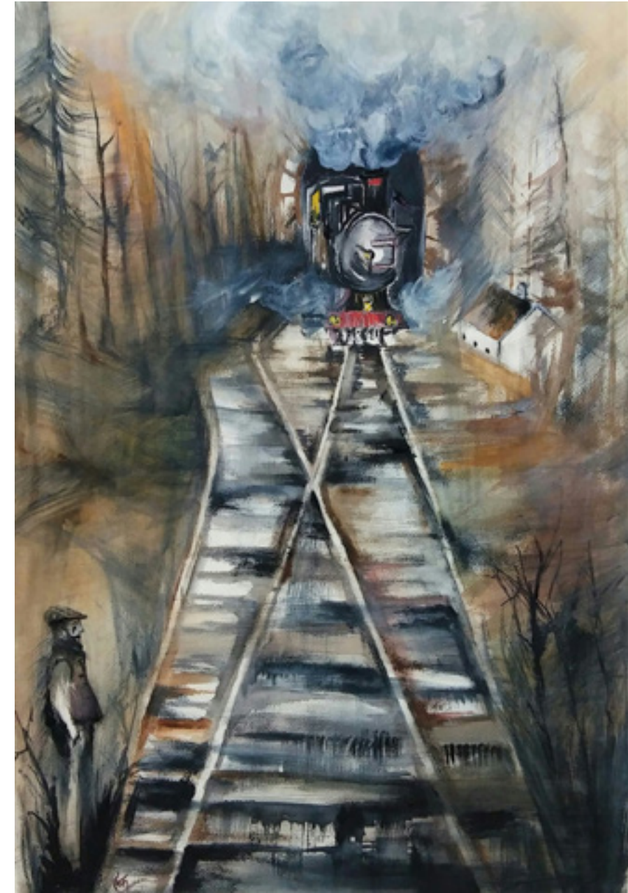
Elvira Gómez Flores “MELANCOLÍA” 50 x 70 cm.

Escenario: unas vías férreas en un paisaje rural. El HOMBRE se ha parado junto a las vías del tren. Escucha venir, de lejos, una locomotora. Se ve, desde fuera, parado junto a los raíles que figuran paralelas que van a encontrarse en el infinito. La locomotora se oye más cerca. Ahora se ve desde arriba, como un punto cercano a dos líneas rectas. Le ha venido a la mente la voz de su antiguo maestro explicando la tangente y ha revivido el olor a lápiz chupado y a pupitre. La locomotora ya está cerca, pero las lágrimas no le permiten verla bien.