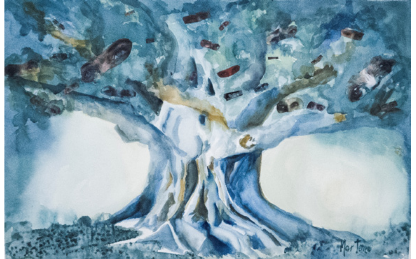
Mar Terrero Cumbre “ENTRE LAS SOMBRAS” 50 x 70 cm.

El negror de la noche: ¿No escuchas en su aroma la música de un tiempo que se extiende en silencio más allá de las lindes del mundo conocido? Un temblor que no es viento sacude entre los árboles las hojas y las sombras, los huecos y destellos de miles de ojos ciegos. Pero en los corazones una luz se presiente que alumbrara hacia el centro del rincón más interno. Es la noche una amante gozosa que se te ofrece entera.