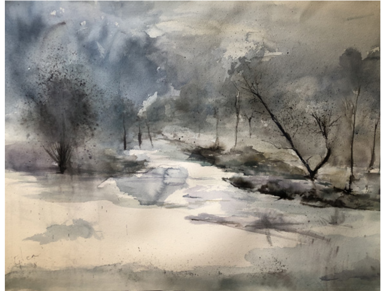
Inmaculada Gutiérrez Gea “LLEGARÉ” 50 x 70 cm.

LLEGARÉ A TI Llegaré a ti alguna tarde inesperada, cuando en los anaqueles levanten su plumaje sorprendido dormidos pájaros de ensueño. Apenas en susurro te hablaré por no romper la magia azul de los silencios. Con toda la ternura del dolor infinito te cogeré la cara entre mis dedos trémulos, te dejaré en los ojos la lluvia blanca de mi amor y posaré en tus labios, como lo hiciera el viento, el temblor de una rosa.