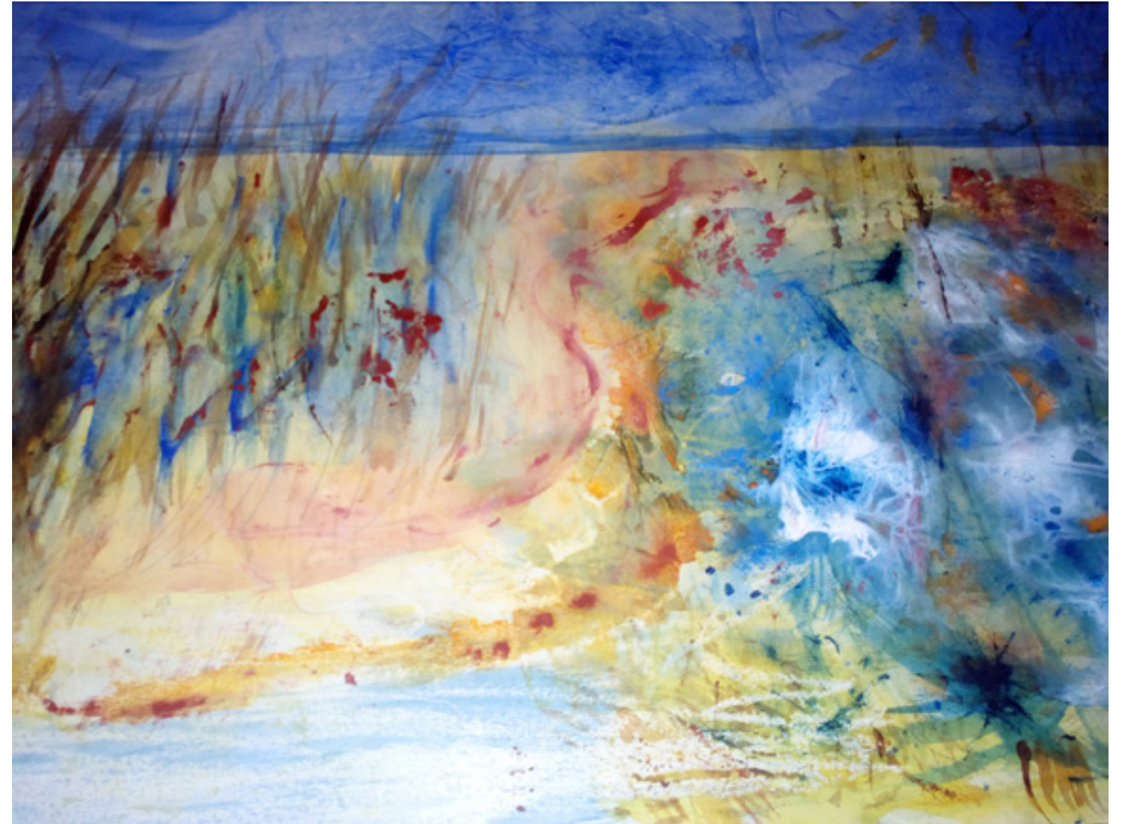
Adolfina Villén “ LA MUERTE Y LA VIDA “ 50 x 70 cm.

¡Ay, vida generosa, cómo te amo! ¡Ay, muerte dolorosa, que te llamo! ¡Ay, muerte y vida y qué y cómo y cuándo! ¡Ay, vida y muerte y caminar cantando! ¡Ay, muerte y vida, como en pozo redondo! ¡Ay, vida y muerte!, ¡y qué alegría tan alta y qué dolor tan hondo!