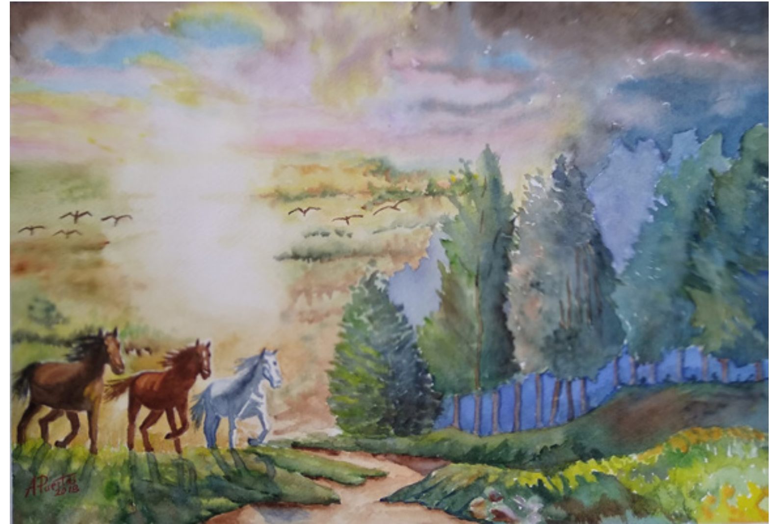
Antonio Puertas Fernández “ SOMBRAS DE LIBERTAD” 35 x 50 cm.

A veces, no sé dónde, escucho una llamada. Es vaga, es imprecisa, pero imperiosa y firme y de una fuerza negra que asusta y que arrebat. Con ella abro las puertas al Otro Territorio. En él las sombras muestran sus ojos encendidos; cielos caleidoscópicos me arrastran a espirales de magia y de misterio. La luz se descompone y espectros de colores bañan con sus reflejos las brumas y los bosques, las nubes y las aguas, las tierras y los vientos. Caballos desbocados cabalgan por oteros y praderas de musgo preñadas de secretos me acogen en su escarcha sensual y traspasada. Los pájaros relucen su sangre derramada y elevan en el aire cantos que son quejidos, gritos que son canciones. Y hasta el dolor es bello. El Otro Territorio es libre y terrorífico; en él la Libertad se abraza con el Miedo y hay un valor insigne que aun entre muchos te hace sentir que estás tan solo, tan único en el mundo como si fuera tuyo, como si fueras nada, como si fueras todo, el dueño de la vida, el esclavo de un sueño, la inquietud de la luna en la noche tranquila, la serena templanza de la muerte asesina.