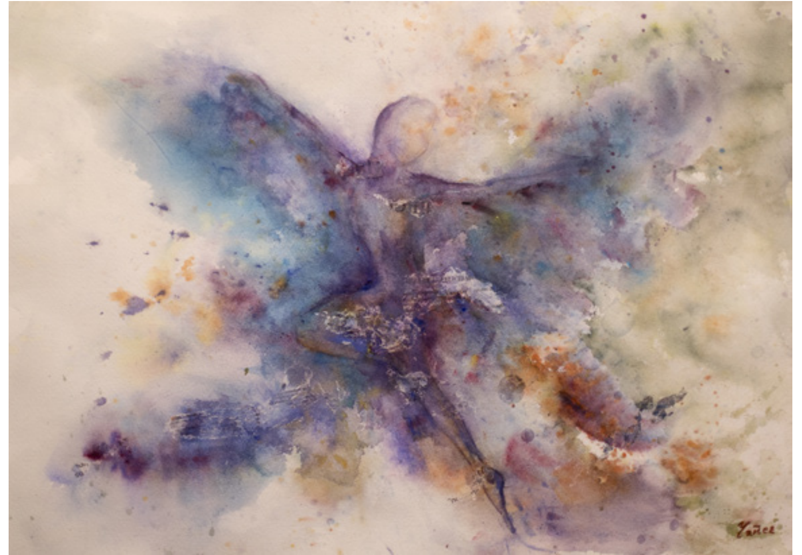
Mari Carmen Yáñez “DESEO” 50 x 70 cm.

¿A qué tiempo pertenece una mariposa azul? En el futuro es un guiño; en el pasado, un poema. En el presente se esfuma como un dibujo en el tul.