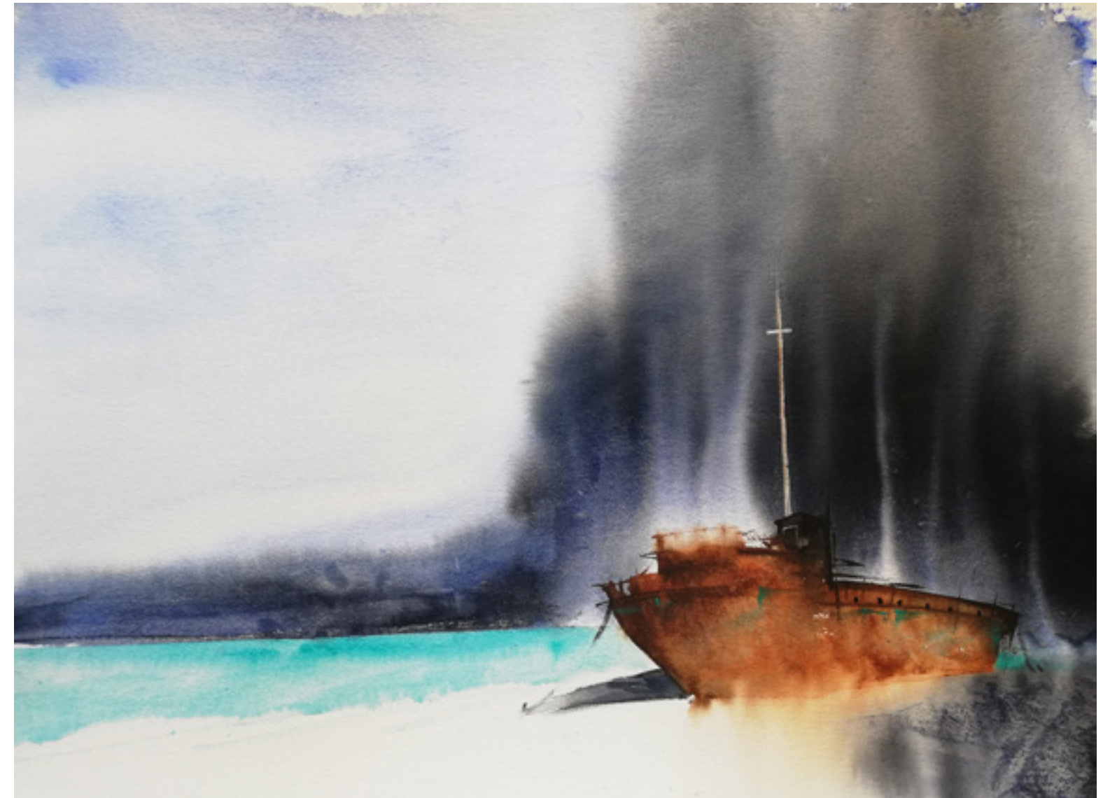
Dory Ruiz “BARCO VARADO” 50 x 70 cm.

Era un mar todo entero de tinta y de nata y yo en él dibujaba espirales con mi dedo de barro. Luego, un viento venía que las desdibujaba y era el mar un espejo de alabastro y de mármol. En sus vetas mi rostro era un barco encallado.