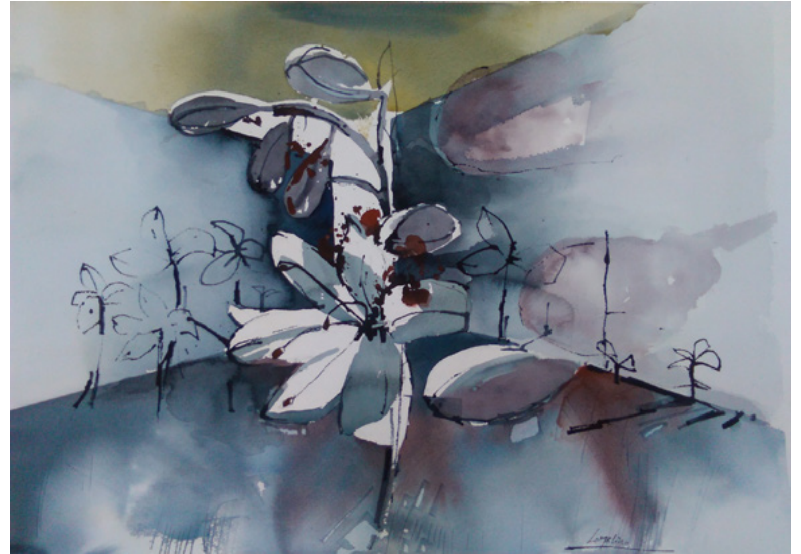
Luis Lomelino Amérigo “LA FLOR DEL ESFODELO” 50 x 70 cm.

Hay algo cuando miro la flor del asfódelo que pregunta qué hay ahí que es algo más que flor pero no vemos. Tiembla mi corazón porque no sabe cómo explicar lo que presiente; pero sí sabe que está ahí eso sin nombre que la palabra no alcanza.