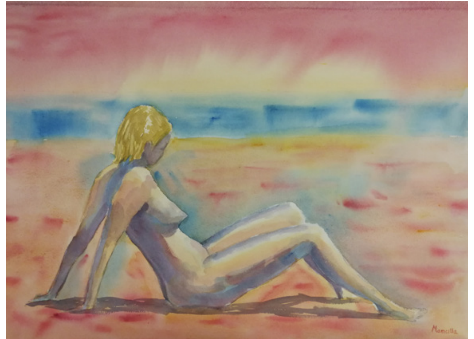
Juan Mancilla Alcántara “MUJER CON PAISAJE” 50 x 70 cm.

Déjame ser el agua de tu fuente, la claridad y el ámbar de tu pelo. Déjame ser la joya que, doliente, vigila junto al lecho tu desvelo, en tu inquietud te arropa y, dulcemente, se muere en el ocaso de tu cielo.