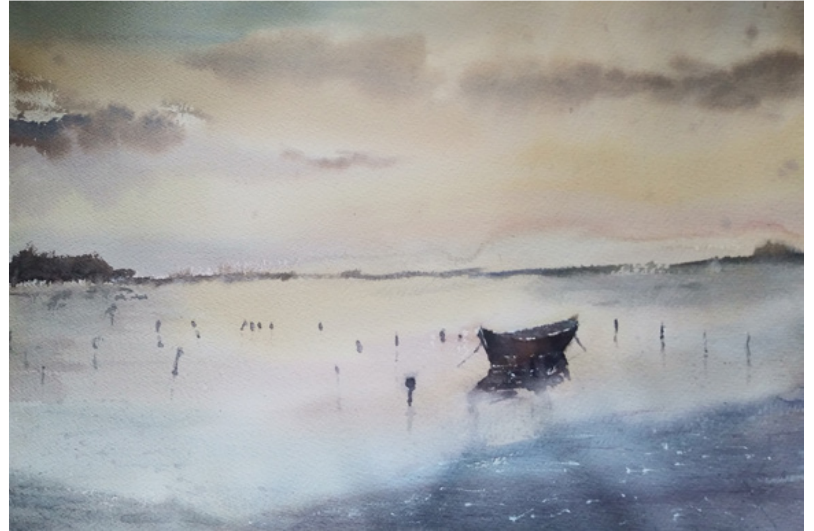
Rafael Aguayo Siles “AMANECE EN EL DELTA” 30 x 50 cm.

Entra dentro, sale afuera... Hay un redoble certero. Se lo ha tragado de golpe el negror del agujero.