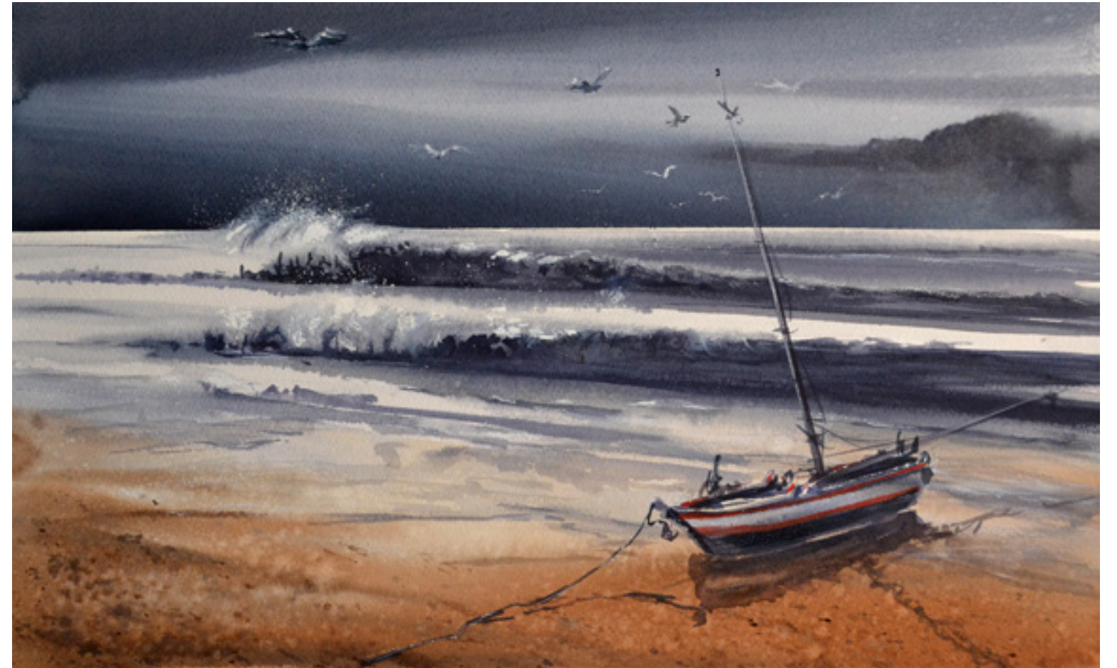
Antonio Luis Cosano Jurado “CON MATICES DE PLATA” 31 x 51 cm.

Le he pedido el secreto que en su paleta guarda y siempre me responde: Es la vida, que pasa.