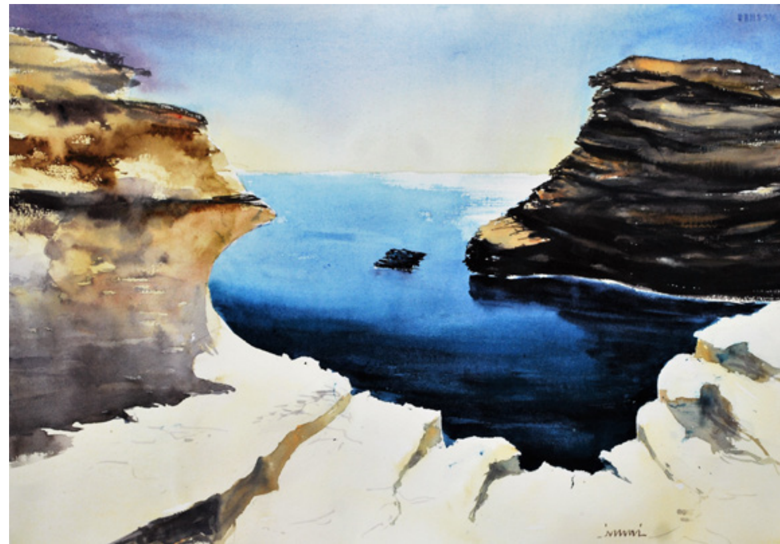
Inmaculada Rumi “LOMA BLANCA” 35 x 50 cm.

La loma sobre la mar era una duna de sal. Y era dura y era blanca. Blanca de sal y de luz, dura de sol y de azul. El mar miraba a la loma. La loma miraba al mar. Yo miraba, en la angostura, la blanca azul soledad.