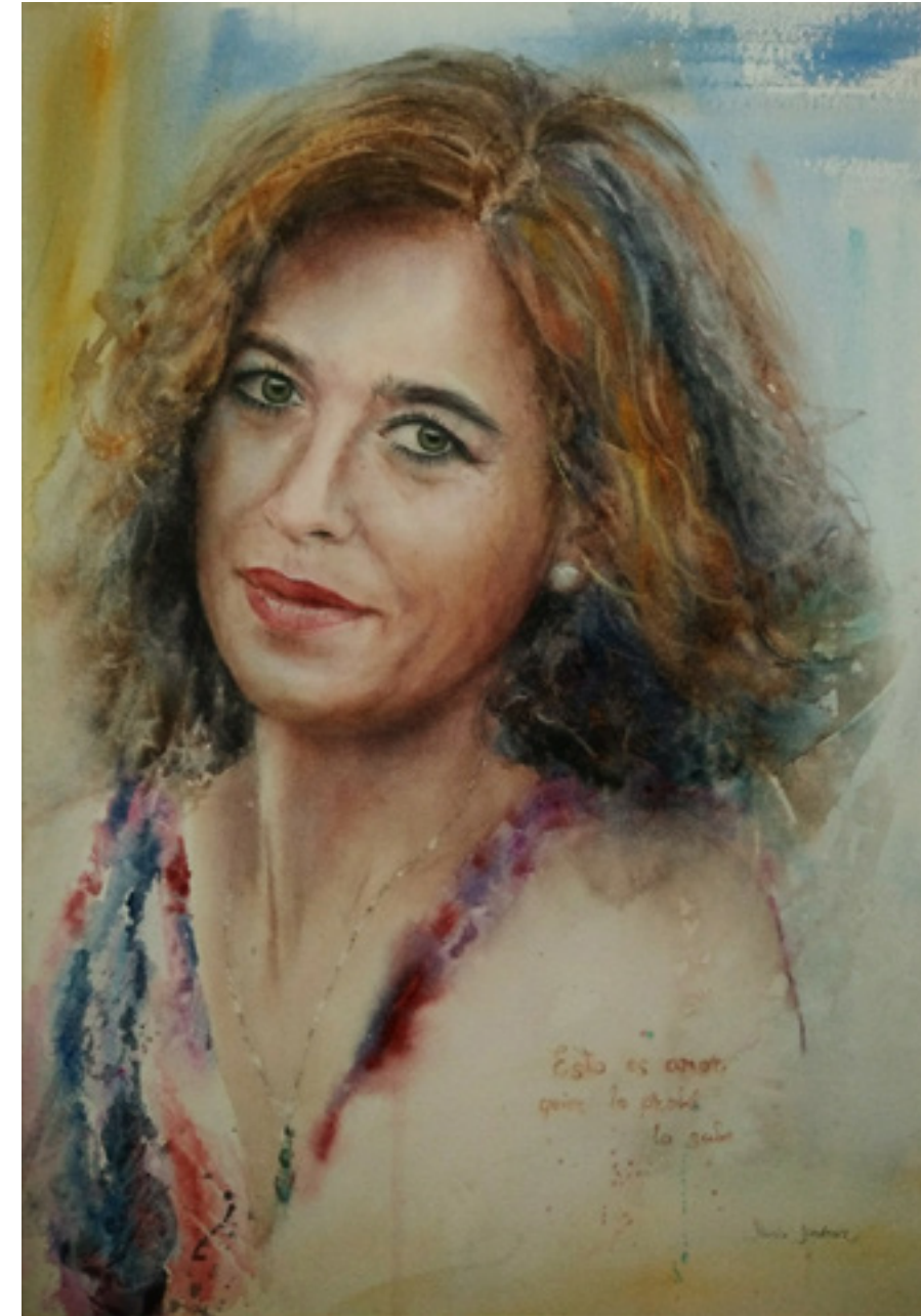
Mari Ángeles Jiménez “ ESTO ES AMOR, QUIEN LO PROBÓ LO SABE” 35 x 50 cm.

de heridas que parece que no acabe si falta su presencia al calendario. Esto es amor, quien lo probó lo sabe.