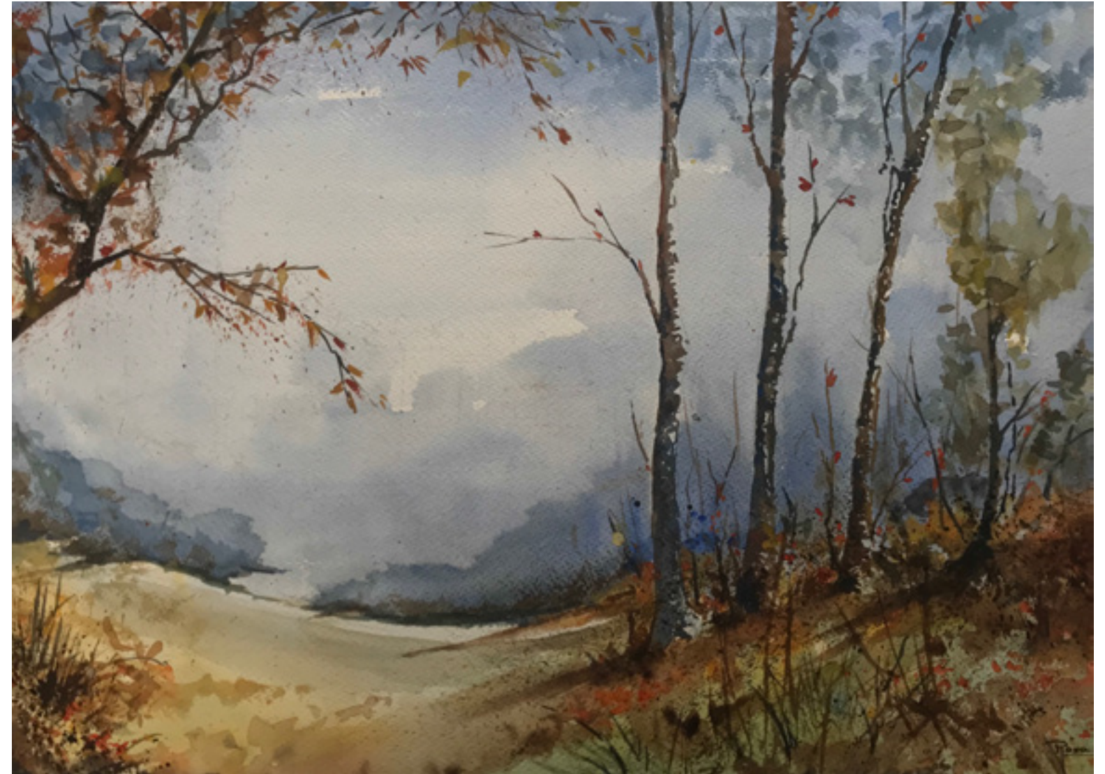
Diego Miguel Rosas “LA TORMENTA” 50 x 70 cm

La tormenta es la voz más feroz de la tierra. Ella puede arrogarse el poder de las aguas que fecundan el campo y atormentan los ríos. Su estallido de luz es ramaje flamígero de árboles que destrozan y suelos que surgen nuevos. En el trueno se escucha el fragor de titanes que levantan montañas y retuercen los mares. Y hay después un silencio y un olor cristalino como a tierra que nace y a jardín primitivo.