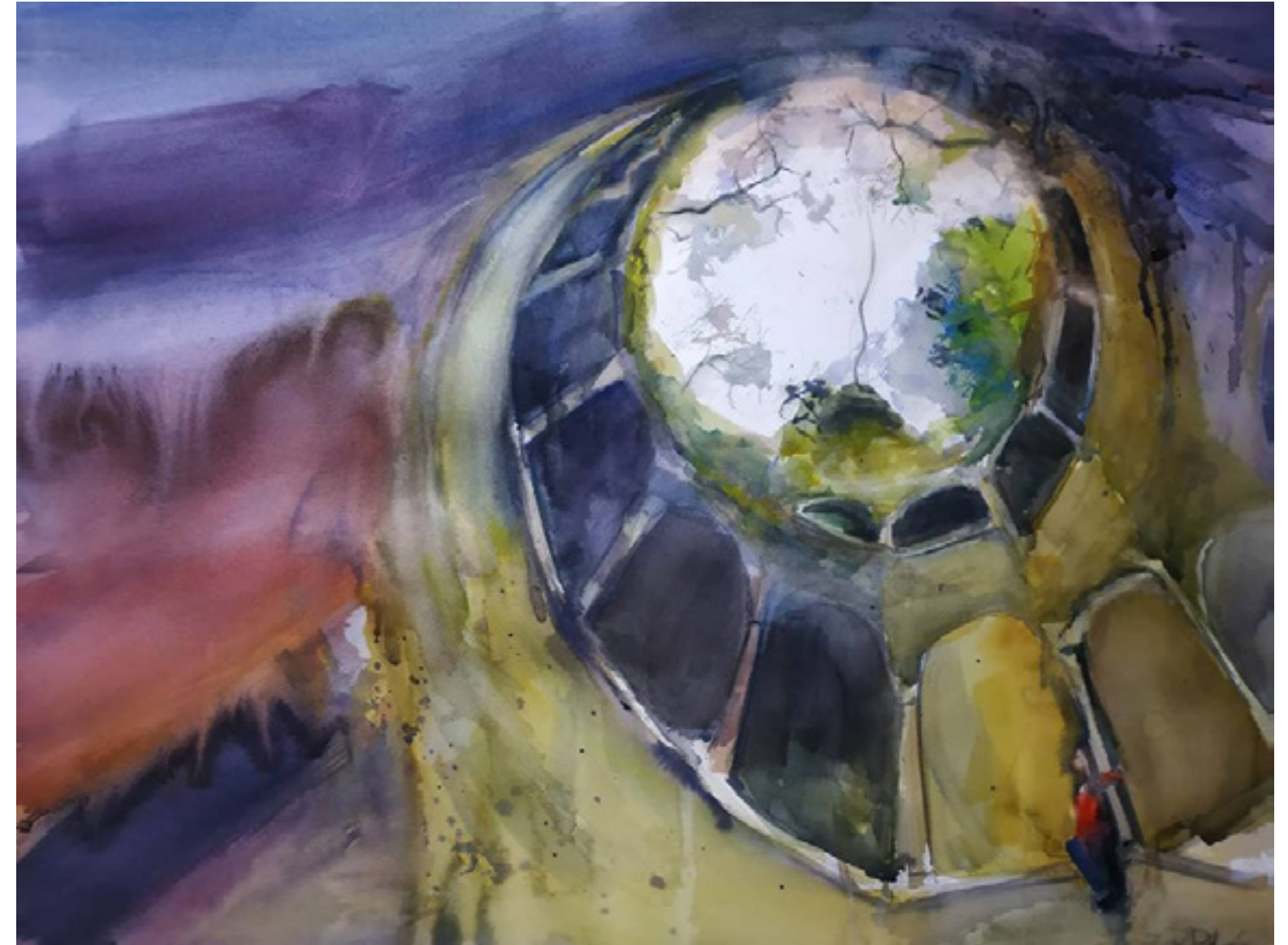
Rosario Peláez Calderón “LA ESPIRAL DE LA QUIETUD” 50 x 70 cm.

En la grieta transparente y ahora oscura... En la grieta está el blancor. Y la negrura.