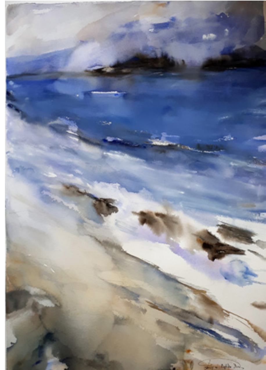
Esperanza Aydillo Díez “ NOS QUEDAMOS MIRANDO LA NEBLINA EN SU BORDE” 50 x 70 cm.

Una niebla cerraba los caminos del bosque. Nos quedamos mirando la neblina en su borde. No pudimos llegar a la cima del monte, mas, qué bellos los cielos en aquel horizonte.