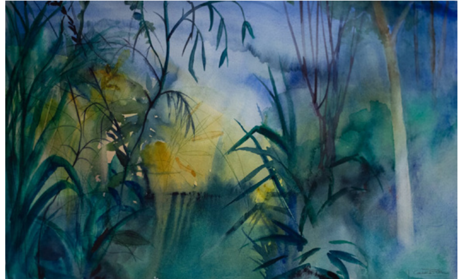
Carmen Fernández Rodríguez “APARECIENDO” 30 x 50 cm.

¡Esta embriaguez serena de los bosques entrando por mi sangre! ¡Esta canción febril y exacerbada que trae el viento a mi boca! ¡Y esta quietud en danza! Puedo escuchar si pongo mi oído por la tierra cómo crece la hierba. Y siento el devenir de las estrellas latiendo por mi sangre. Venas que fueron fuego y son rosa doliente, que apenas fueron lirio y son simiente. ¡Y este morir en cada destello que amanece y este vivir sobre aguas en que el sol se adormece!