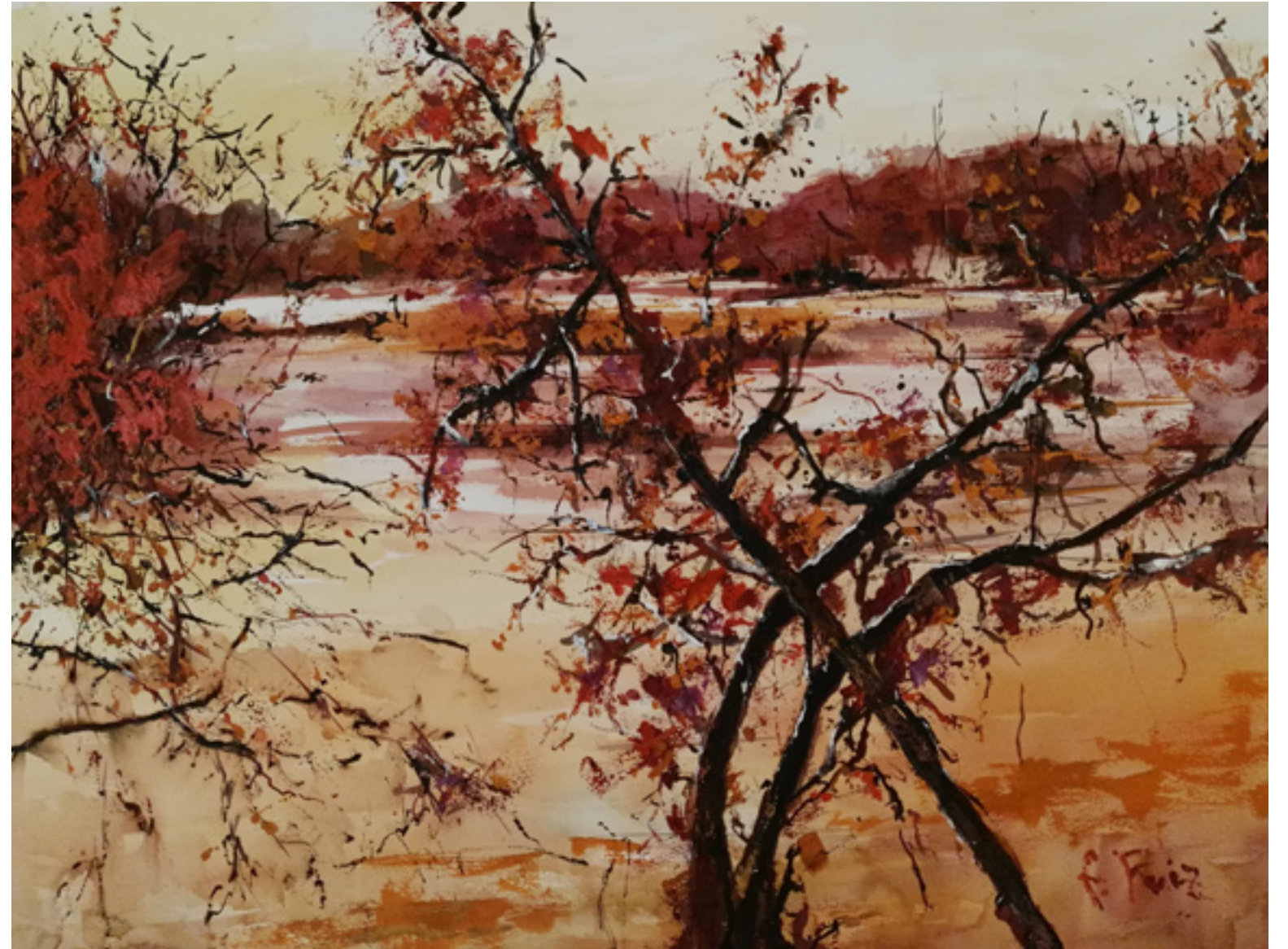
Francisco Ruiz “LOS COLORES SE LEVANTAN” 50 x 70 cm.

El sol que se despereza abre la nueva mañana. ¿No ves cómo de los bordes de las cosas surge un aura dorada que las enciende? ¿No sientes la melodía de colores que se extiende sin sombra hasta el horizonte? Con su solo y a su ritmo el sol invita a la danza. ¡Deja los fardos y baila! Hoy es fiesta; está de gala la luz y la vida es franca.