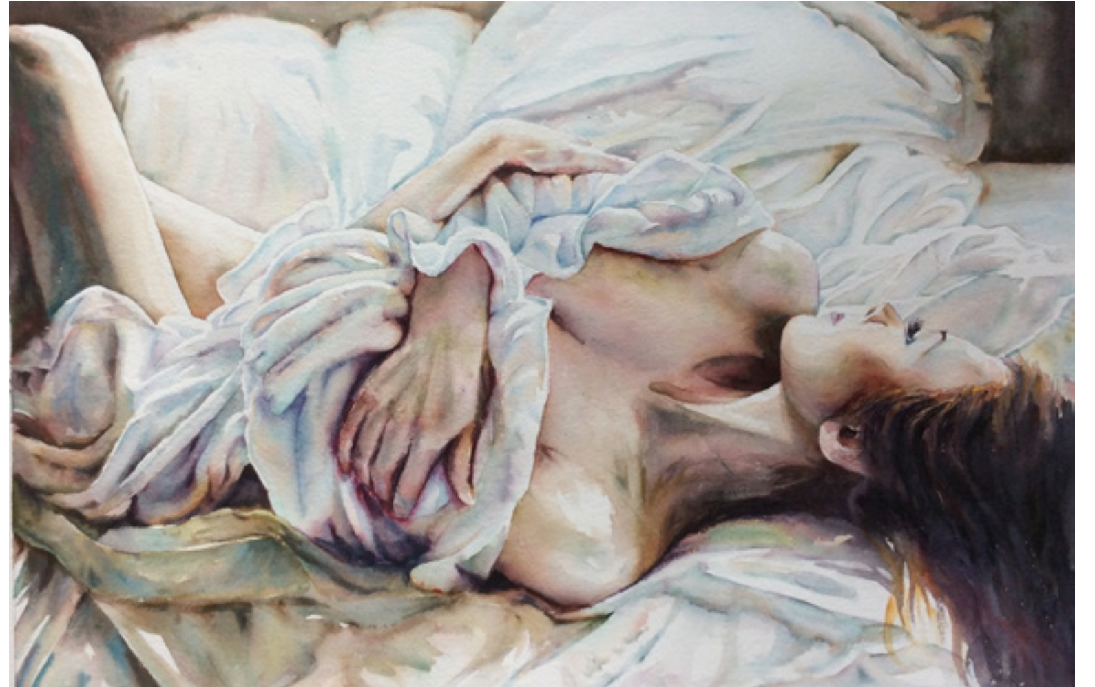
Maribel López Martos “ DOLOR” 45 x 65 cm.

...Y que luego el amor, con su susurro alado, recoja mis pedazos y me lama en la llaga hasta recomponerme entre su lumbre y hacerme un brillo más de su ascua emocionada.